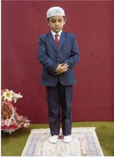
Resim: 3 Kıyam.

Kıyam ve Kıraat: Kıyam ayakta durmak, kıraat ise ayakta iken Kur'an'dan bir veya birkaç ayet, sure okumak demektir.