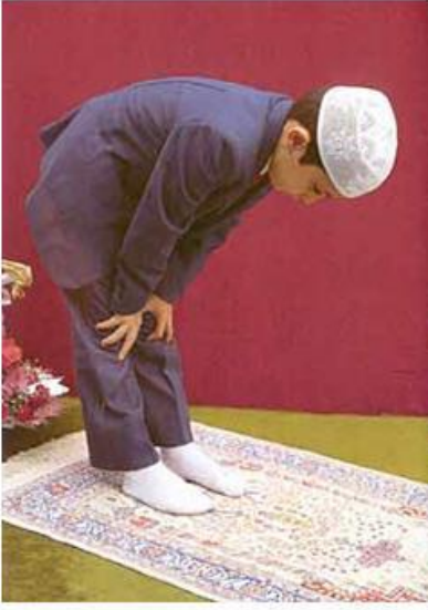
Resim: 5 Rükü.

Gözler iki ayak ucuna bakıyor. Baş ile arka aynı hizada, sırt düz vaziyette ve yere paralel durumda. Bacak ve kollar gergin. Parmaklar ağık, sıkıca dizkapaklarını kavramış vaziyette.