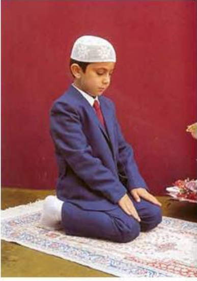
Resim: 9 Ka'de.

Gözler oyluklara bakıyor. Eller oyluklar üzerinde, parmaklar kendi halinde. Sol ayak yatık ve üzerinde oturulmuş. Sağ ayak dik ve başparmağı kibleye dönük.