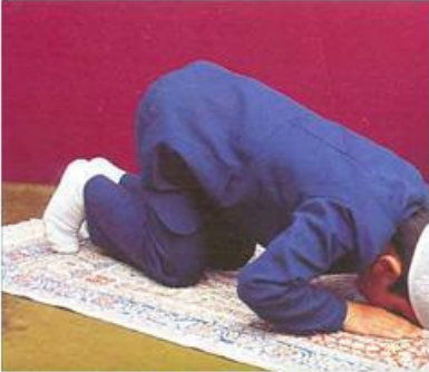
Resim: 7 Secde.

Secde: Rükudan sonra namazda elleri, alını, burnu, dizleri yere koyarak yere kapanmak demektir. Secde her rekatta ikişer defa yapılır. Secdede "Sübhanerabbiley a'lâ" denilir.