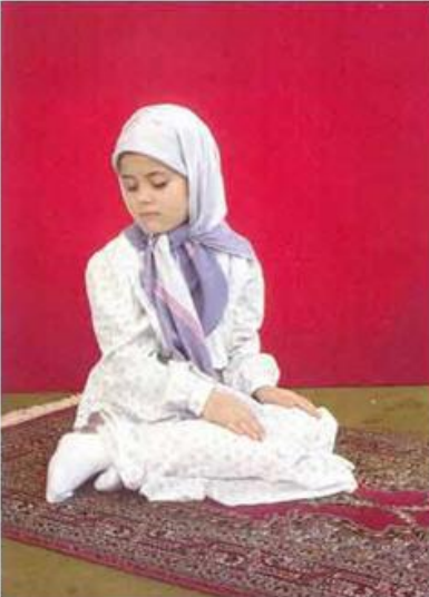
Resim: 12 Sağa Selam.

Eller oyluklar üzerinde, parmaklar kendi halinde. Sağ ayak dik, başparmak kibleye dönük. Baş sağa çevrilmiş ve gözler omuza bakıyor.