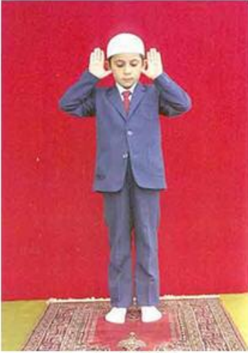
Resim: 1 Tekbir.

Gözler secde yerine bakıyor. Ellerin içi kibleye dönük, başparmak kulak yumuşağına değiyor. İki ayak birbirine paralel, ayaklar arasında 4 parmak sığacak kadar mesafe var.