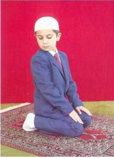
Resim: 11 Sağa Selam.

Selam: Namaz bitince önce sağ tarafa, sonra sol tarafa "Es-selamü aleyküm ve rahmetullah" diyerek selam verilir.