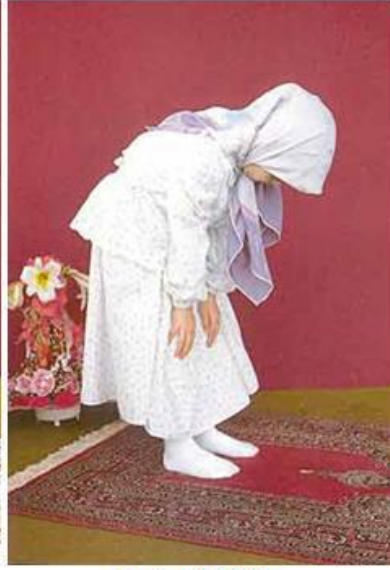
Resim: 6 Rükü.

Gözler iki ayak ucuna bakıyor. Baş ile arka aynı hizada, sırt düz vaziyette ve yere paralel durumda. Bacak ve kollar gergin. Parmaklar ağık, sıkıca dizkapaklarını kavramış vaziyette.