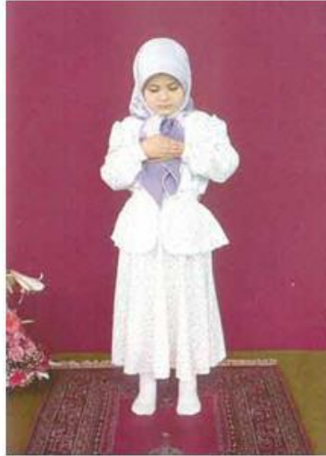
Resim: 4 Kıyam.

Gözler secde yerine bakıyor. Eller göbük altında bağlanmış vaziyette. Sağ elin küçük parmağıyla başparmak, sol elin bileğini halka gibi kavramış şekilde. İki ayak arası 4 parmak kadar açık ve birbirine paralel.