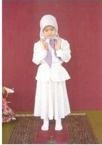
Resim: 2 Tekbir.

Gözler secde yerine bakıyor. Ellerin içi kibleye dönük, başparmak kulak yumuşağına değiyor. İki ayak birbirine paralel, ayaklar arasında 4 parmak sığacak kadar mesafe var.