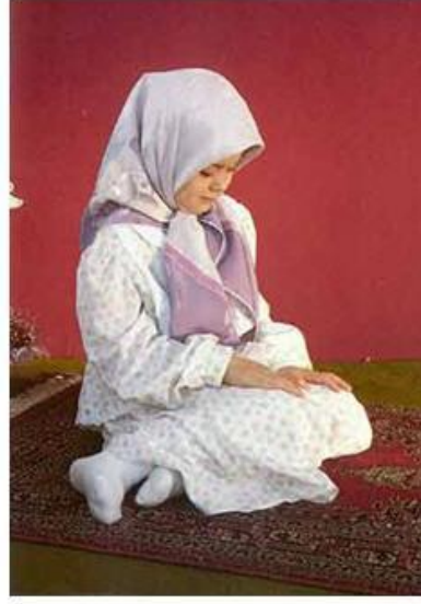
Resim: 10 Ka'de.

Gözler oyluklara bakıyor. Eller oyluklar üzerinde, parmaklar kendi halinde. Sol ayak yatık ve üzerinde oturulmuş. Sağ ayak dik ve başparmağı kibleye dönük.